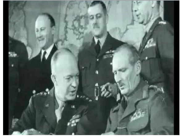
Albay James Stagg (önde sağda) ve General Dwight Eisenhower. (önde solda).

Bu haftaki perşada gördüğümüz gibi, Bilam, ödül ve itibar arzusu nedeniyle, Tanrı’nın “Hayır” cevabını kabul edememişti. Yalnızca “Evet” cevabını duymak istiyordu. Ancak James Stagg, gerçek sorumluluğun, bazen, etrafınızdaki herkes sizden bir “Evet” beklediği zaman bile, hoş karşılanmayacak bir cevap vermeyi gerektirdiğini anlamıştı. Ve Eisenhower dinledi, gereken ayarlamaları yaptı ve fırtınayı atlatarak ordusuna güvenle liderlik etti.